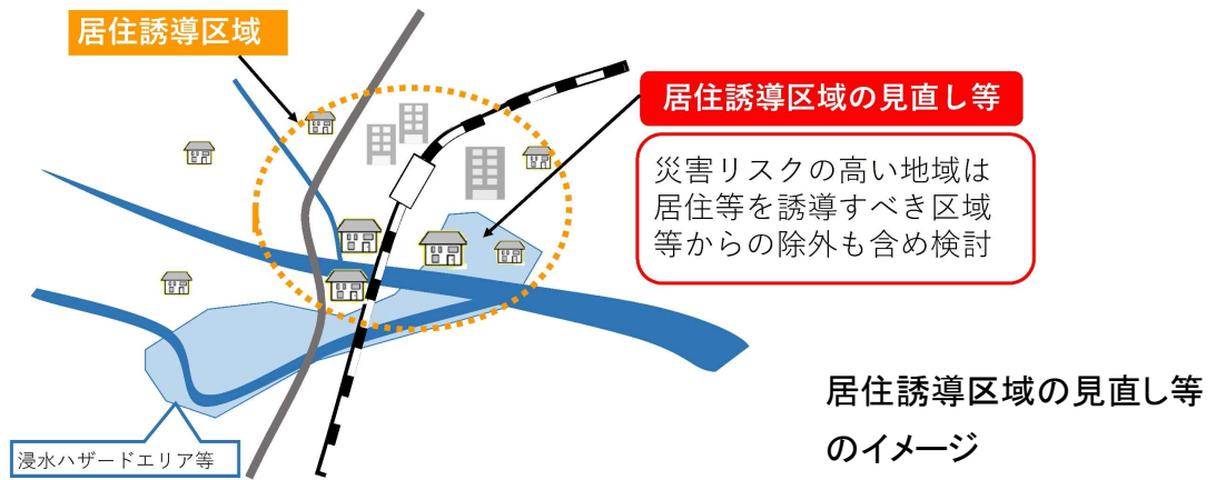
居住誘導区域の見直し等のイメージ

引き続き災害の発生のおそれのある土地の区域においては、居住誘導区域からの除外も含め、長期的・全市的な視点で区域の見直しを図る。