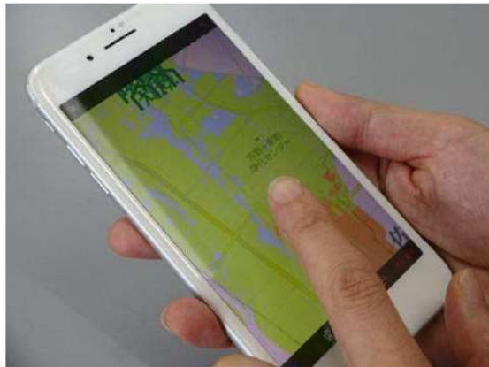
ウェブ版ハザードマップのイメージ

・様々なハザードマップをパソコンやスマートフォンで容易に閲覧できるウェブ版ハザードマップを導入し、市民の防災意識の啓発・向上を図る。(R2年度より実施予定。)