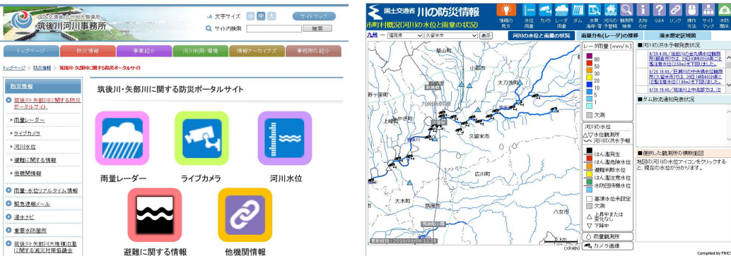
「筑後川・矢部川防災ポータルサイト」のページ例

・各防災行政機関が各機関のHPにおいて発信している防災情報サイトを利用者がアクセスしやすいようにとりまとめ、一元的に閲覧できる「筑後川・矢部川防災ポータルサイト」を筑後川河川事務所HPに開設し、地域の防災力向上(自助・共助)を図る。 ※実施中