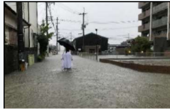
池町川左岸 浸水状況 (H30年7月)