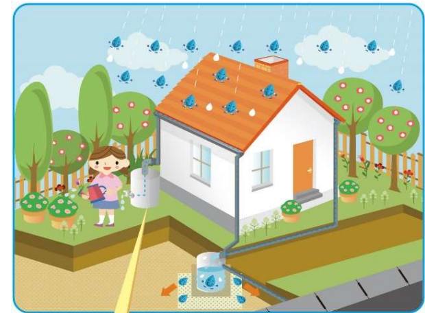
雨水貯留施設(タンク)

・河川・水路等への雨水流出を抑制するための雨水貯留施設(タンク)の設置に要する費用の一部を助成する制度の創設を行う。